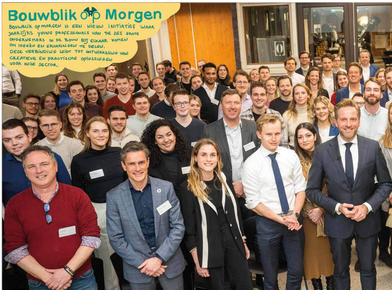
Inmiddels zijn er al veel mensen betrokken bij het initiatief 'Bouwblik op Morgen'.

Als 'Bouwblik op Morgen', jongerenvertegenwoordigers in de bouw, benadrukken we dat we deze uitdagingen niet geïsoleerd kunnen aanpakken. Het is van cruciaal belang om onze overmoedige overtuiging van het oplossen van deze problemen binnen onze eigen kaders te doorbreken. Samenwerking en het omarmen van innovatieve, toekomstgerichte perspectieven zijn noodzakelijk om als sector duurzame veranderingen te realiseren die ons allemaal zullen beïnvloeden. Samenwerken an sich is daarbij een steeds belangrijkere